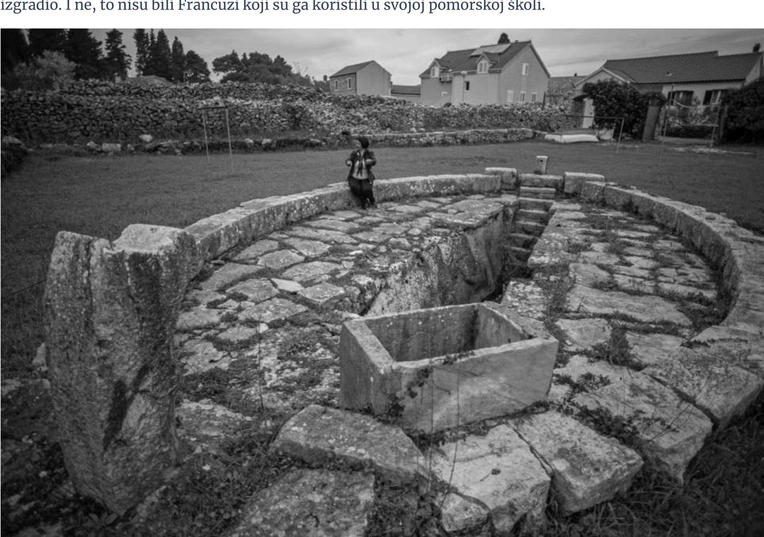
Doktor Ostojić je uz ladanjsku kuću za sina Nikolu, na posjedu izgradio i 'kameni bazen u obliku broda', a Klaudija Gamulin smatra da je to učinio kako bi umirio sina koji se protivio njegovoj novoj vezi.

Razigranost neba i nebeskih tijela pružala im je uzbudljiv dojam kao da to vide prvi put. Kad bi im se oči privikle na mrak, činilo im se kao da se to neobično kameno plovilo kreće. Pogleda uprtog u instrumente ondašnjeg vremena, oktant i sekstant, doživljavali bi iskustvo koje neće zaboraviti kad se jednog dana nađu na otvorenom moru. A za potpuni ugođaj, noge su im bile u 'mokra', jer ni jedan pravi brod ne smije propuštati vodu. Trup broda i danas je u vodi, koju su nekada vinogradari toga polja koristili za zalijevanje. Brod je tako koristio i pomorcima i vinogradarima. Vino i more ionako od pamtivijeka žive u simbiozi“, rekonstruirala je Klaudija Gamulin povijest kamene učionice, a uspjela je istražiti i tko je kameni brod izgradio. I ne, to nisu bili Francuzi koji su ga koristili u svojoj pomorskoj školi.